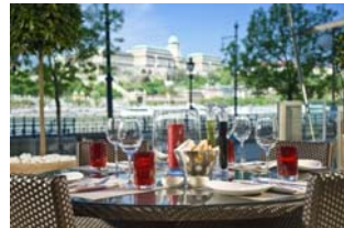
※写真ブダペスト マリオット ホテルのイメージです。